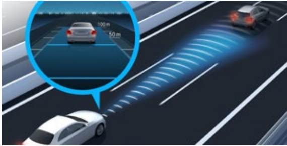
ระบบช่วยรักษาระยะห่างจากรถคันหน้า (Active Distance Assist DISTRONIC)*