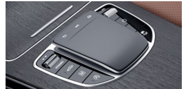
ระบบควบคุม และสั่งงานแบบสัมผัส (Touchpad)