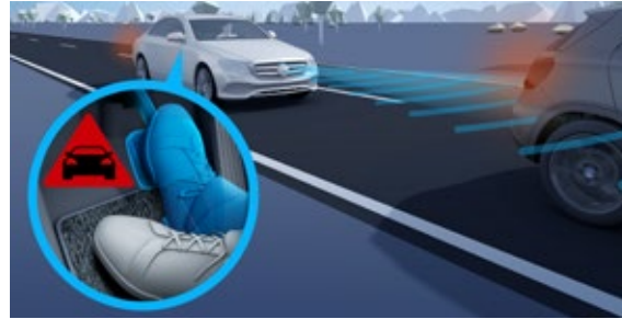
ระบบช่วยเบรกแบบแอคทีฟ (Active Brake Assist)