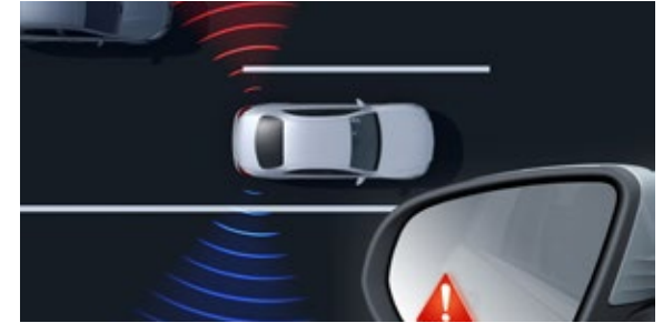
ระบบช่วยเตือนขณะเปลี่ยนช่องจราจร (Blind Spot Assist) เฉพาะรุ่น GLC 220 d AMG Dynamic