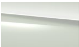
149 polar white