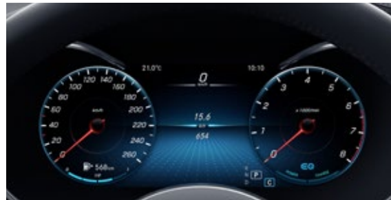
มาตรวัดความเร็ว และวัดรอบเครื่องยนต์แบบ All-Digital Instrument Display ขนาด 12.3 นิ้ว*