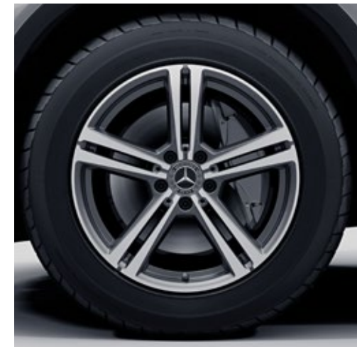
ล้ออัลลอยแบบ 5 ก้านคู่ ขนาด 18"

พบกับการตกแต่งภายนอกอันโดดเด่นที่จับตามองได้ในอุปกรณ์มาตรฐาน โดยเฉพาะอุปกรณ์ตกแต่งโครเมียม และล้ออัลลอยดีไซน์โฉบเฉี่ยวที่ดึงดูดสายตา พร้อมไฟหน้าแบบ LED High Performance ที่มาพร้อมระบบปรับไฟสูงอัตโนมัติ รวมไปถึงปลอกท่อไอเสียชุบโครเมียมสร้างไดนามิกที่แตกต่างให้กับรถยนต์