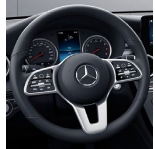
พวงมาลัยนัลติฟังก์ชัน Nappa พร้อมปุ่มควบคุมแบบ Touch Control