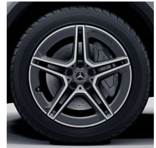
ล้ออัลลอยด์ดีไซน์สปอร์ตจาก AMG แบบ 5 ก้านคู่ ขนาด 19" ตกแต่งด้วยสี tremolite grey

การตกแต่งภายนอกที่เน้นความคมชัดของ AMG Line ที่ให้ความรู้สึกสปอร์ตไม่เหมือนใคร AMG Line เป็นถ้อยแถลงที่แสดงให้เห็นถึงการออกแบบอันทรงพลังได้อย่างชัดเจน ความพิเศษด้านเทคนิคมอบความเร้าใจในการขับขี่ที่มากกว่าเดิมจนคุณรู้สึกได้ ด้วยระบบกันสะเทือนพร้อมระบบบังคับเลี้ยวโดยตรงแบบสปอร์ตช่วยให้ควบคุมการขับขี่ได้ดียิ่งขึ้น รวมไปถึงไฟหน้า MULTIBEAM LED ที่ช่วยเพิ่มวิสัยทัศน์ในการขับขี่ได้อย่างสมบูรณ์แบบ