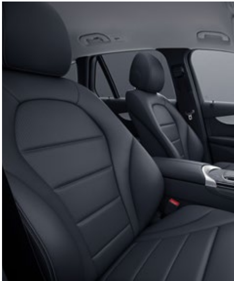
101 ARTICO man-made leather - black