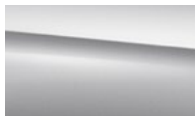
775 iridium silver