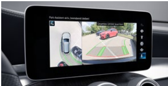
ระบบช่วยการนำรถเข้าจอดอัตโนมัติ พร้อมกล้องแสดงภาพรอบทิศทางขณะถอยจอด*