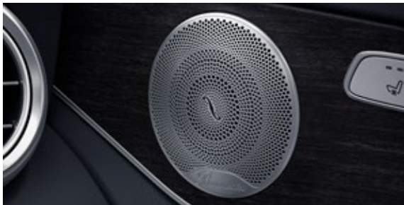
ระบบเสียงรอบทิศทาง Burmester®*