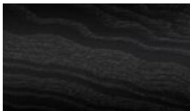
736 Open-pore black ash wood trim