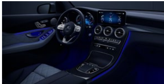
ไฟเรืองแสงล้อมรอบห้องโดยสารปรับได้ 64 เฉดสี (Ambient Lighting)