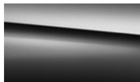
197 obsidian black