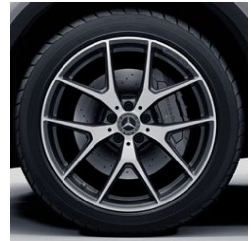
ล้ออัลลอยด์ดีไซน์สปอร์ตจาก AMG แบบ 5 ก้านคู่ ขนาด 20" ตกแต่งด้วยสีดำ

ล้ำและแรงไปอีกขั้น ด้วยการทำงานร่วมกันของเครื่องยนต์เบนซิน และมอเตอร์ไฟฟ้า ที่ช่วยเพิ่มประสิทธิภาพการขับขี่ให้ดียิ่งขึ้นกว่าเดิม และยังสามารถพาคุณทะยานไปได้ไกลกว่าที่เคย ด้วยพลังงานไฟฟ้าเต็มรูปแบบ รวมไปถึงไฟหน้า MULTIBEAM LED อันโดดเด่น ที่ตอบสนองต่อสภาพจราจรได้อย่างรวดเร็ว