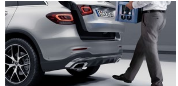
ระบบกุญแจแบบ KEYLESS-GO พร้อมระบบเปิด-ปิดบานประตูท้ายอัตโนมัติโดยไม่ต้องใช้มือ*