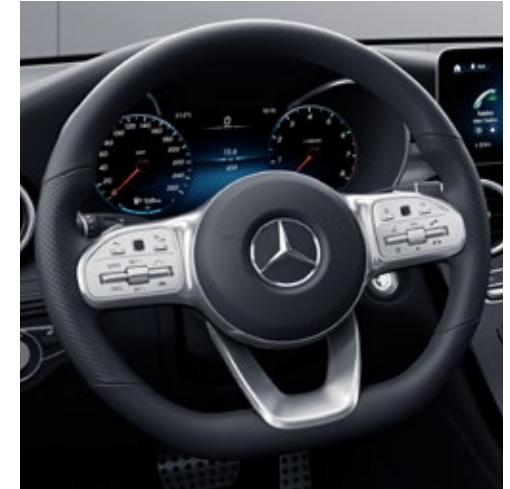
พวงมาลัยนัลติฟังก์ชันกี sport steering wheel ตกแต่งด้วยหนัง nappa พร้อมปุ่มควบคุมแบบ Touch Control