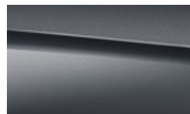
831 graphite grey